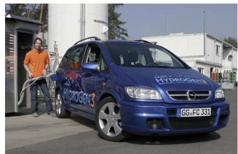
sera au volant de l'OPEL Zafira (PAC)