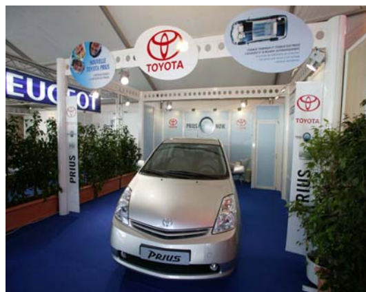
Toyota - Prius