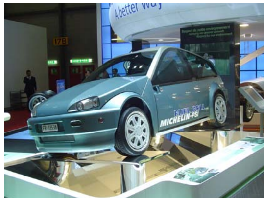
Michelin - HY-LIGHT